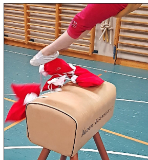
Den störrischen Esel beladen