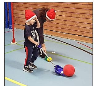
Schneeschaufeln vor dem Samichlaushaus

Die Geschäftsleitung wünscht allen BTV-lerinnen und BTV-lern frohe Weihnachten und einen guten Rutsch ins neue Jahr.