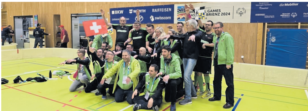
Die beiden Unihockeyteams jubeln über ihre Erfolge.

An den National Winter Games in Brienz/Haslital feierten die Athletinnen und Athleten des BTV Chur Behindertensport grosse Erfolge. 25 Sportlerinnen und Sportler nahmen zusammen mit sechs Betreuern an den Wettkämpfen in den Disziplinen Langlauf, Schneeschuhlauf und Unihockey teil und kehrten mit insgesamt sieben Medaillen zurück.