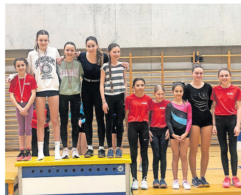
Das Podest in der Kategorie Level 1.