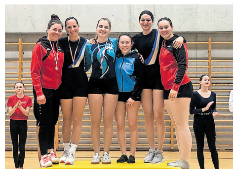
Das Podest in der Kategorie Basis.