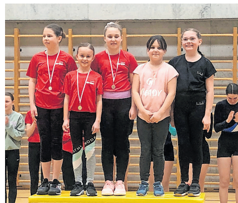
Das Podest in der Kategorie A1.