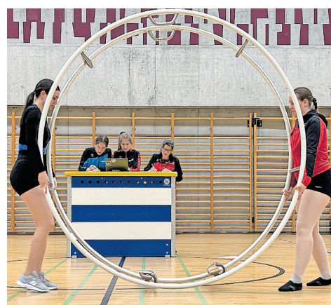
Überall ist Konzentration gefragt: Beim Radausrichten wie auch im Wertungsbüro.