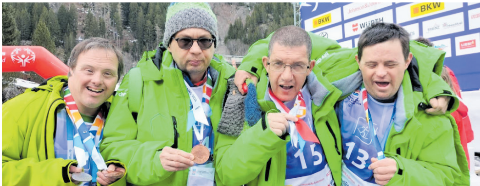
Medaillenregen bei der Delegation Langlauf/Schneeschuhlauf.