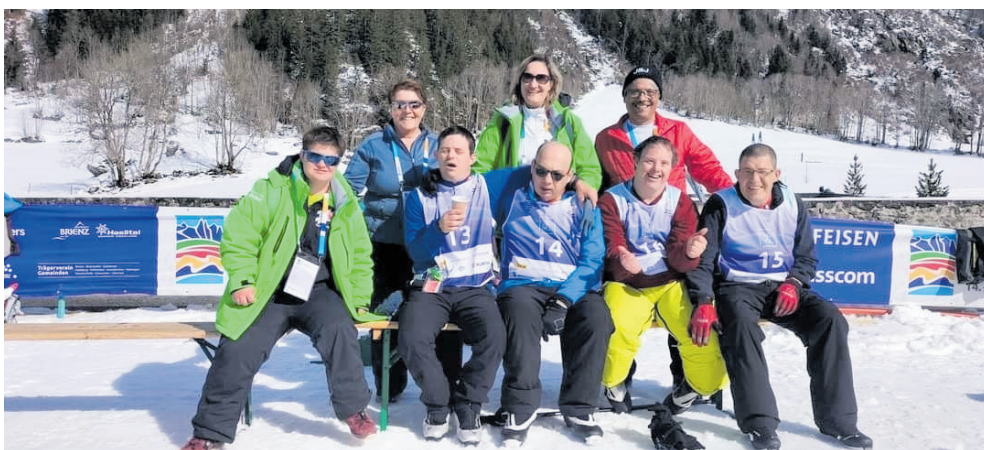
Grosse Freude bei der Delegation Langlauf/Schneeschuhlauf.